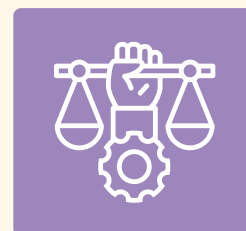
GOVERNANCE ET ÉTHIQUE