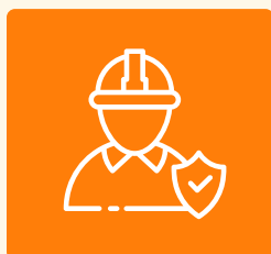
SANTÉ ET SÉCURITÉ